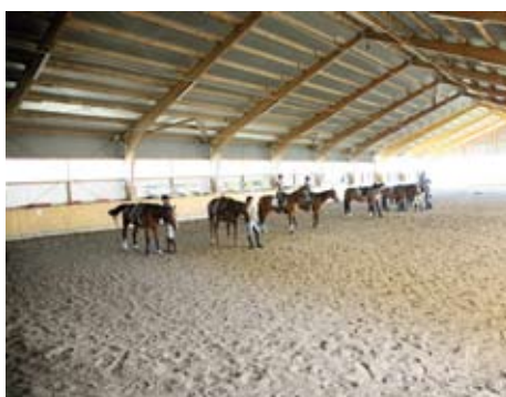
Lüneburger Heide - Große und helle Reithalle

Pferde, Reitprogramm: Rund 50 Pferde, davon ca. 20 Schulpferde. FN-Reitstall mit Berufsreitlehrer und qualifizierten Ausbildern. Reithalle (20x60 m) mit Reiterstübchen, Außenreit- und Springplatz.