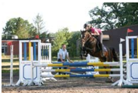
Springunterricht auf dem Reitplatz