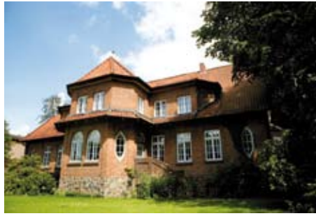
Reiterhof in der Lüneburger Heide (Haupthaus)

nen geführten Ausritt, hier lernen wir „unser“ Pferd und die Umgebung kennen. Direkt am Hof beginnende Reitwege laden zu herrlichen Geländeritten durch die Heide ein. Außerhalb des Unterrichts auch freie Nutzung der Reithalle/ Reitplätze. Teilnahme am Unterricht oder an geführten Ausritten vor Ort buchbar. Voraussetzung: Erfahrung in Pferdepflege, Geländereiten (auch ohne Führung), absolute Sattelfestigkeit. Ein Reiter muss die o.g. Qualifikationen besitzen und die Verantwortung für mitreisende evtl. schwächere Reiter übernehmen. Aus Sicherheitsgründen gemeinsame Anmeldung von mindestens zwei Reitern erforderlich. Nette Mitreiter finden Sie unter www.pferdreiter.de/mitreiter .