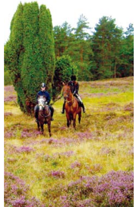
Lüneburger Heide: Besenheide, Wacholderbüsche und Wald