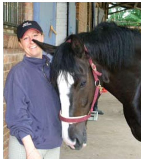
Reiten wie mit dem eigenen Pferd - enger Kontakt zum Urlaubskameraden

Für alle Reiter, die schon immer von einem Privatpferd geträumt haben: an 6 Tagen in der Woche haben wir „unser“ Pferd zur freien Verfügung. Putzen, Füttern, Satteln, Reiten – nirgends sonst haben wir die Gelegenheit, so engen Kontakt zum Pferd zu bekommen. Das Reitprogramm bestimmen wir selbst (Kartenmaterial vor Ort). Am Samstagabend findet ein Vorgespräch statt, um das passende Pferd für jeden Reiter zu finden. Am Sonntagmorgen unternehmen wir ei-