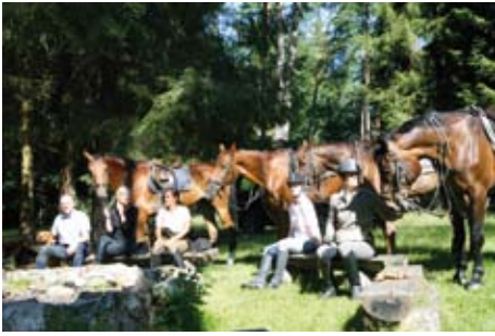
Heideritt - kleine Verschnaufpause