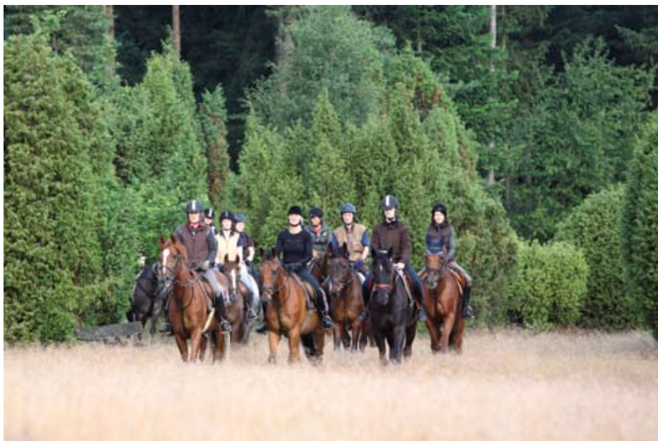
Ausritt durch die Wacholder-Heide